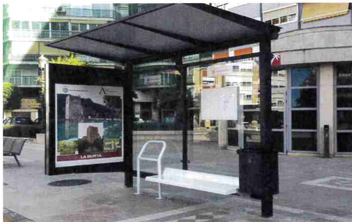
La Alberca, 2 de Septiembre 2021

INSTAMOS al Ayuntamiento de Murcia que a través de la concejalía de Movilidad Sostenible solicite a la Empresa LATBUS la colocación de una parada de autobús con marquesina en sustitución de los bancos de madera en el lugar donde actualmente está situada la parada.